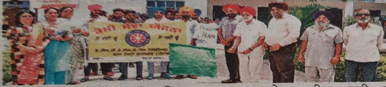
चमकौर साहिब